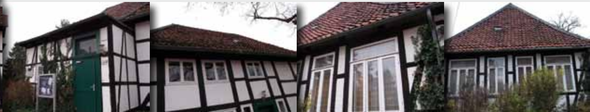
Maroder Zustand eines denkmalgeschützten Gebäudes