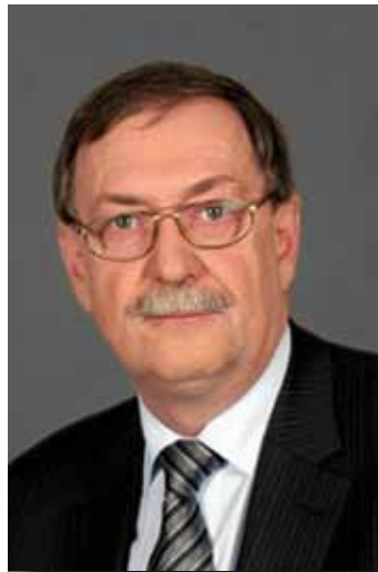
Gert Lindemann Niedersächsischer Minister

ben und zum Standard erhoben, der für alle landwirtschaftlichen Betriebe gilt und eingehalten werden muss.