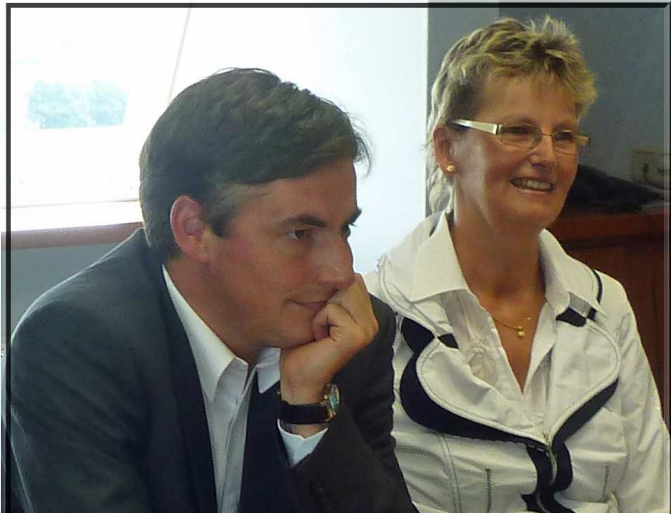
Ministerpräsident David McAllister zu Besuch bei der Firma Lisega AG in Zeven und beim Melkhus Schröder in Deinstedt