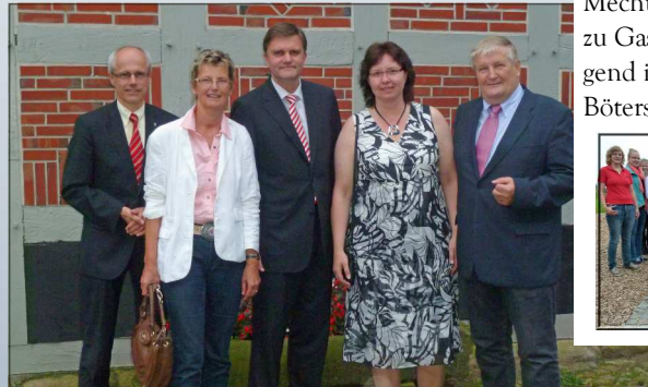
Innenminister Schünemann sprach in Rotenburg zum Thema: „Ehrenamt ist Ehrensache“