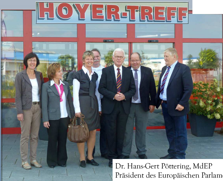
Dr. Hans-Gert Pöttering, MdEP Präsident des Europäischen Parlaments a.D. zu Besuch bei der Firma Hoyer in Visselhövede