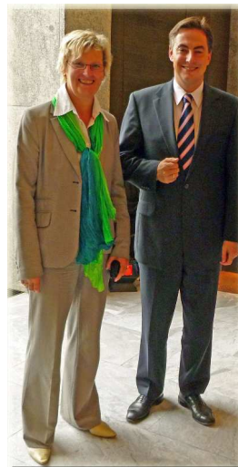
Plenum 09/ 2010