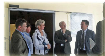
Besuch des Diakoniekrankenhauses 08/2010