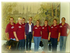
Mehrgenerationenhäuser brauchen Zukunft 09/2010