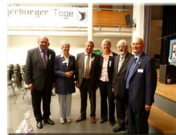
56. Angerburger Tage 09/2010