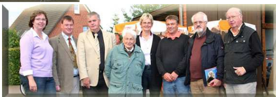
Scheunenfest GV Rotenburg 08/210