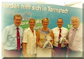
Tarmstedter Ausstellung 07/2010