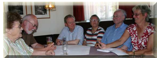
Rotenburger Runde 07/ 2010